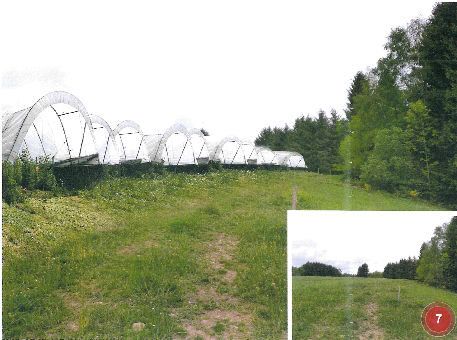
PHOTO LA PLUS PROCHE POUR SITUER LE TERRAIN DANS LE PAYSAGE LOINTAIN